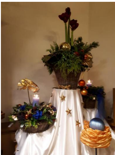
Kerstversiering in Eext door Sietske Huitema en Greet Staal foto en tekening: Wiebe Bijker en